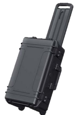
Große Transportkoffer auch als Trolley mit langlebigen, leicht- laufenden Rollen und benutzer- freundlichem, ausziehbarem Griff