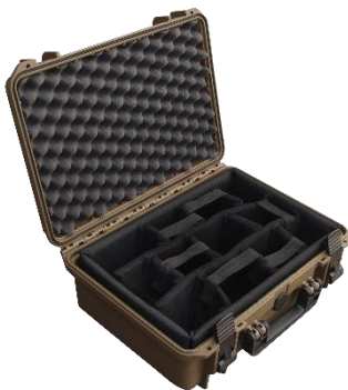
Jetzt neu auch in der Farbe SAHARA erhältlich