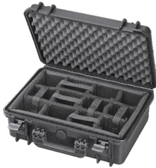
Version CAM mit verstellbarer Facheinteilung