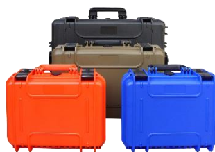
In vielen verschiedenen Ausführungen erhältlich