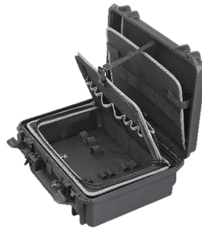
Version TOOL mit vielseitiger Fächereinteilung