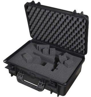
Optional mit selbst konfigurierbarem, mehrlagigem Rasterschaumstoff ausgelegt